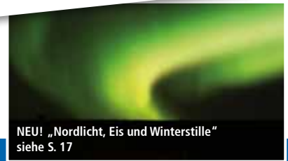
NEU! „Nordlicht, Eis und Winterstille“ siehe S. 17